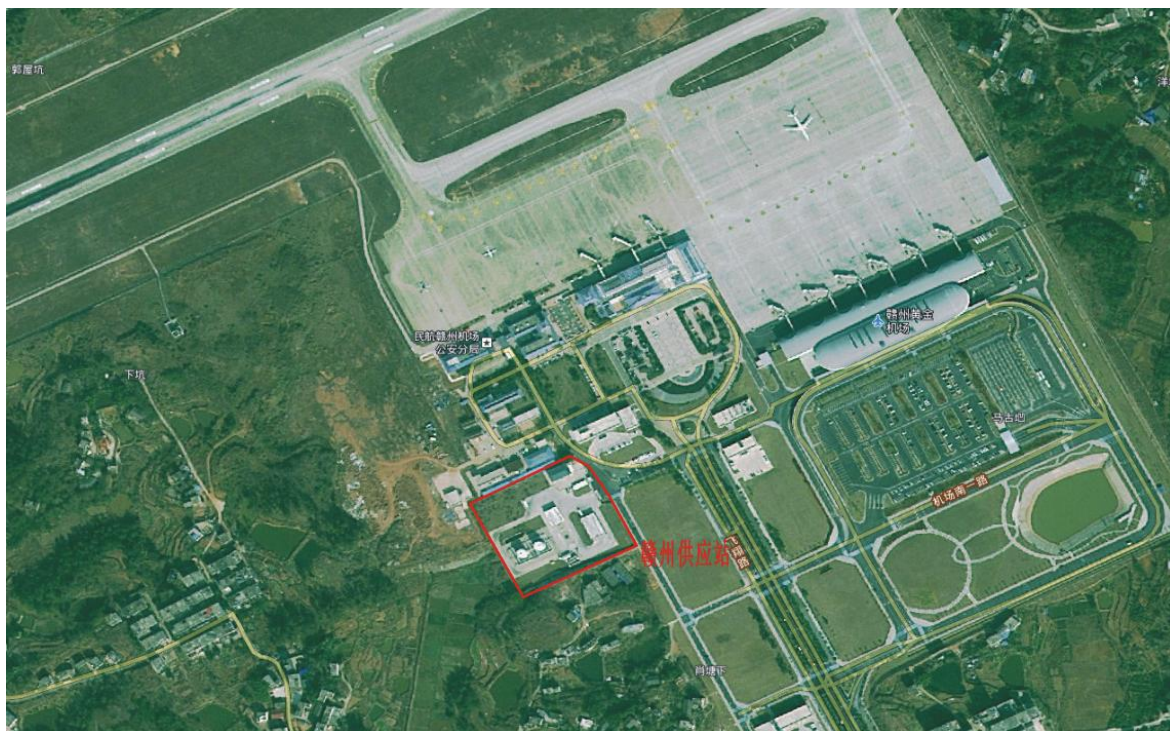
图2.2-1 供应站位置卫星图

赣州供应站东侧边界距离机场进出主道路（飞翔路）约 112m，距离最近的高速公路 G76 厦蓉高速约 1065m；周边 1000m 范围内无铁路、河流。